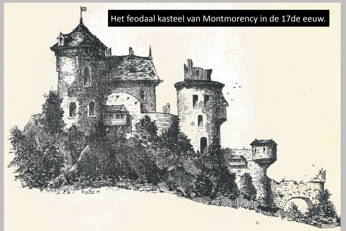
Het feodaal kasteel van Montmorency in de 17de eeuw.