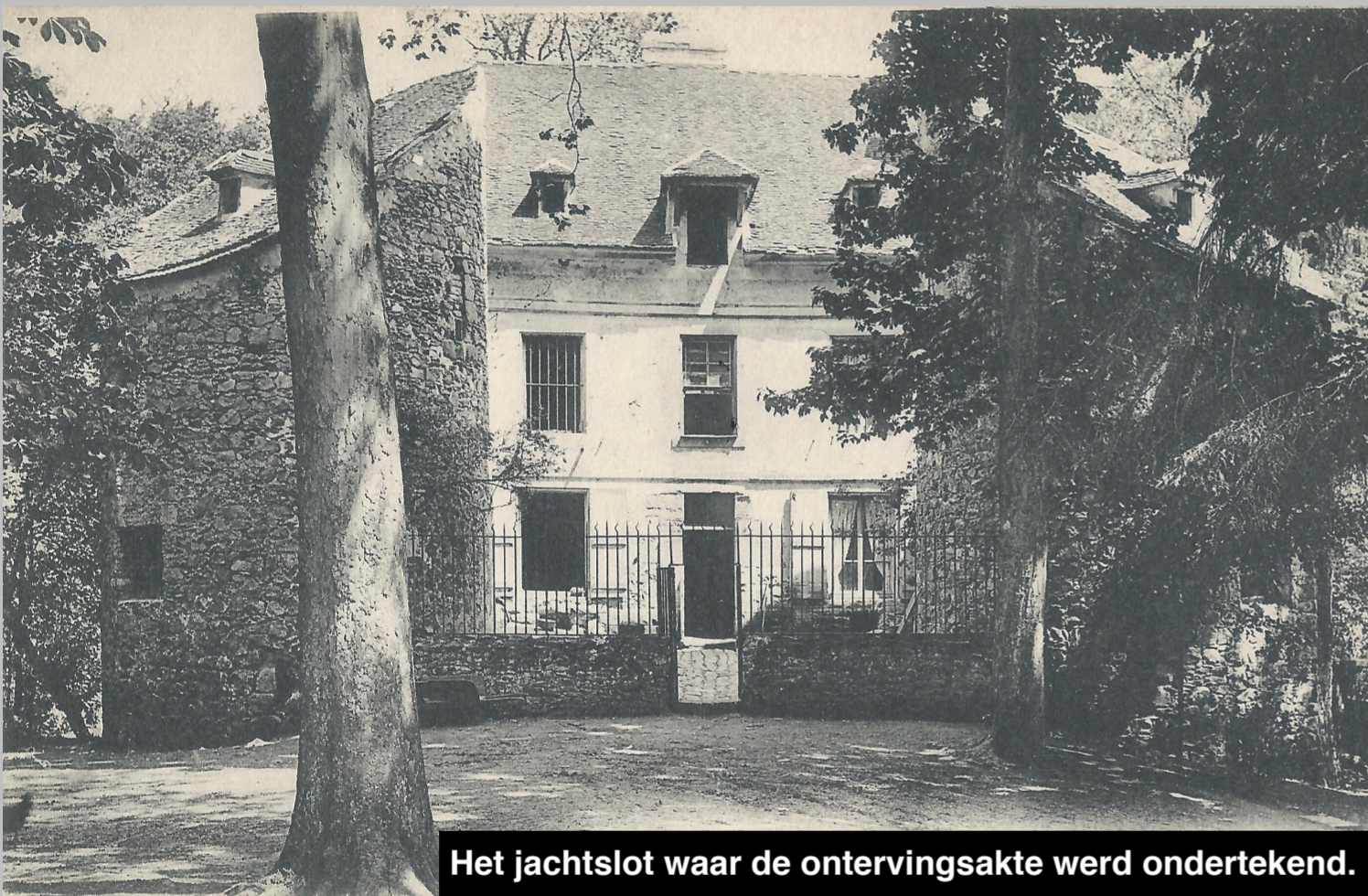
Het jachtslot waar de ontvingsakte werd ondertekend.

Jan II, verontwaardigd over het gedrag van zijn zoon, liet hem via hoorngeschal terug roepen maar Jan III gaf hier geen gehoor aan. Daarop riep Jan II: “ Ce chien de Jean de Nivelles, il s'enfuit quand on l'appelle ”. Deze uitroep ligt aan de basis van de Franse uitdrukking “il est comme le chien de Jean de Nivelles, il s'enfuit quand on l'appelle ” een uitspraak die gebruikt wordt in het Frans voor iemand die niet komt als men hem nodig heeft; iemand die laf is. Na dit voorval ontferfde Jan II zijn twee oudste zonen Jan III en Louis.