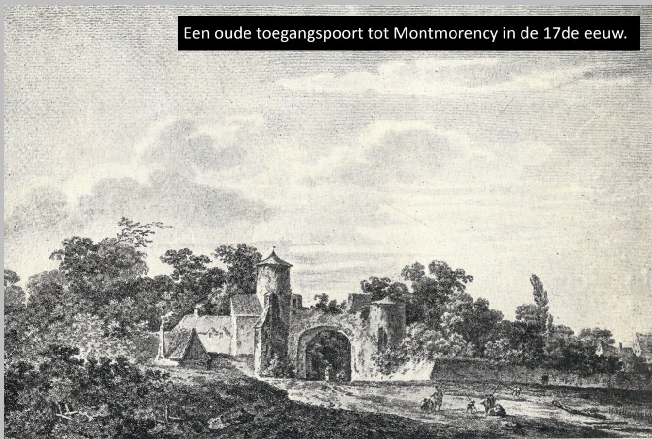
Een oude toegangspoort tot Montmorency in de 17de eeuw.